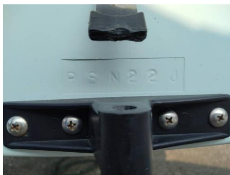
建造シリアルナンバー